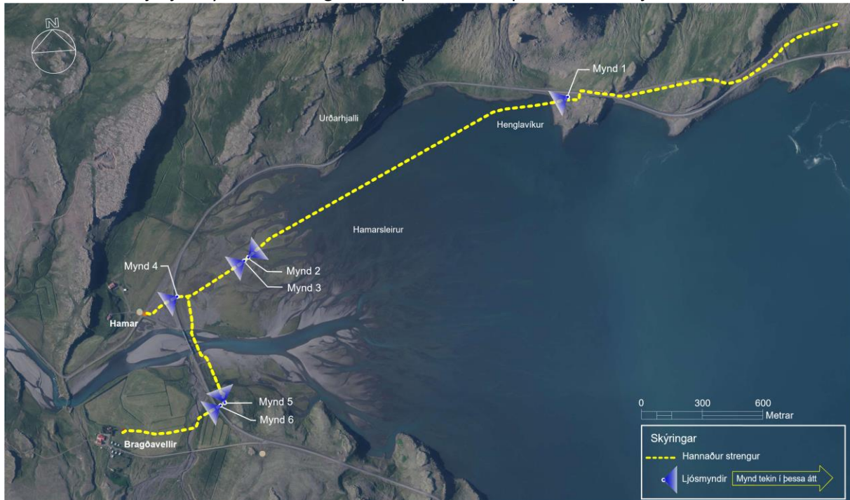
Mynd 3: Yfirlit yfir ljósmyndir af framkvæmdasvæðinu - bláu keilurnar sýna í hvaða átt viðkomandi mynd er tekin. Ljósmyndirnar eru í viðauka 2 við þessa skýrslu.

Í viðauka 2 má sjá ljósmyndir af strengleiðinni þar sem hún þverar Hamarsfjörðinn um Hamarsleirur.