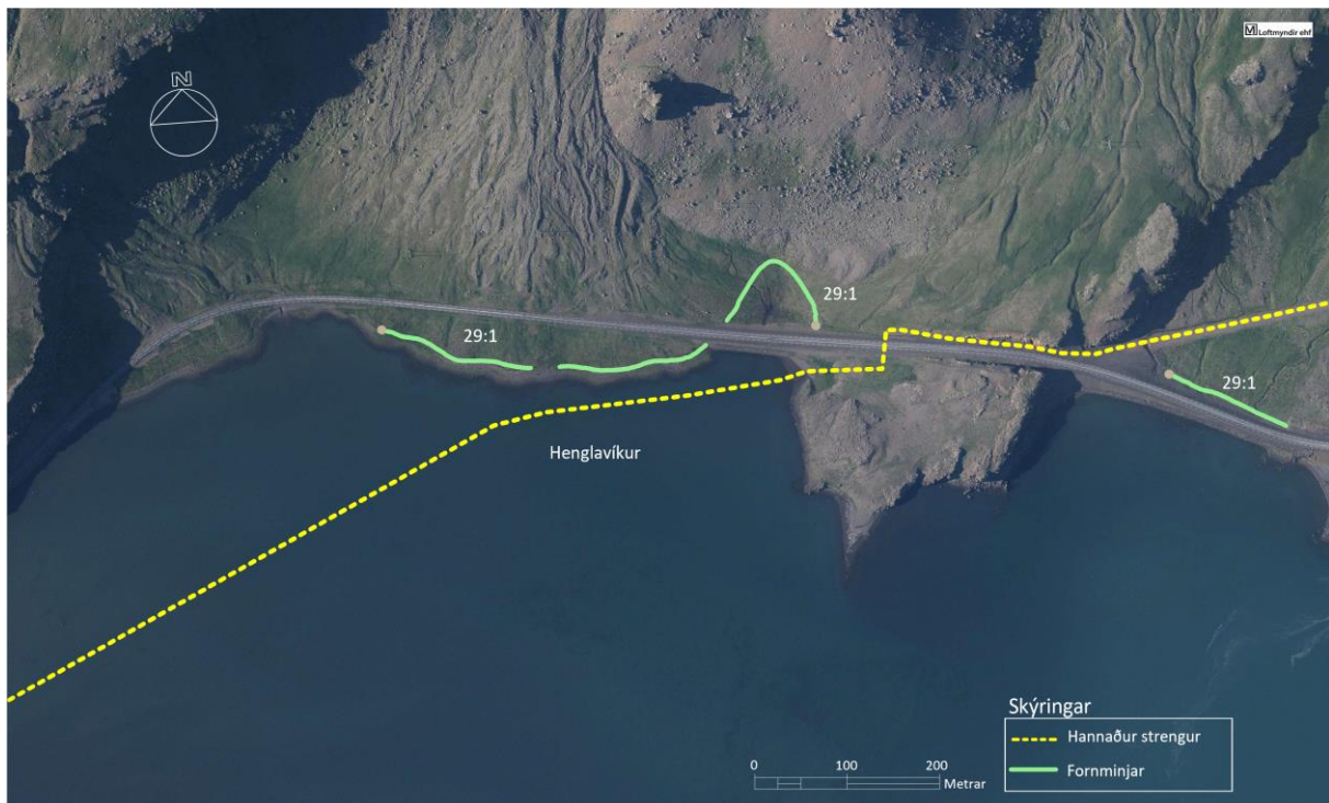
Mynd 4: Fornleifar nr. 29 (Þjóðleið) og hönnuð strengleið (gul brotalína), ásamt númer á minjum

Viðbrögð RARIK: Strengurinn fer næst minjunum um 40 metra og stafar því lítil hættu af strenglögnum en til þess að vernda minjarnar fyrir öllu raski verða þær vel merktar fyrir framkvæmdir.