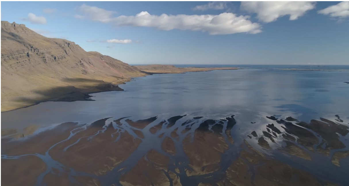
Mynd 1: Hamarsfjörður

Greinargerð um fyrirhugaða framkvæmd vegna strenglagningar um Hamarsleirur í sveitarfélaginu Múlaping, ásamt lýsingu á staðháttum og áhrifasvæði framkvæmdarinnar.